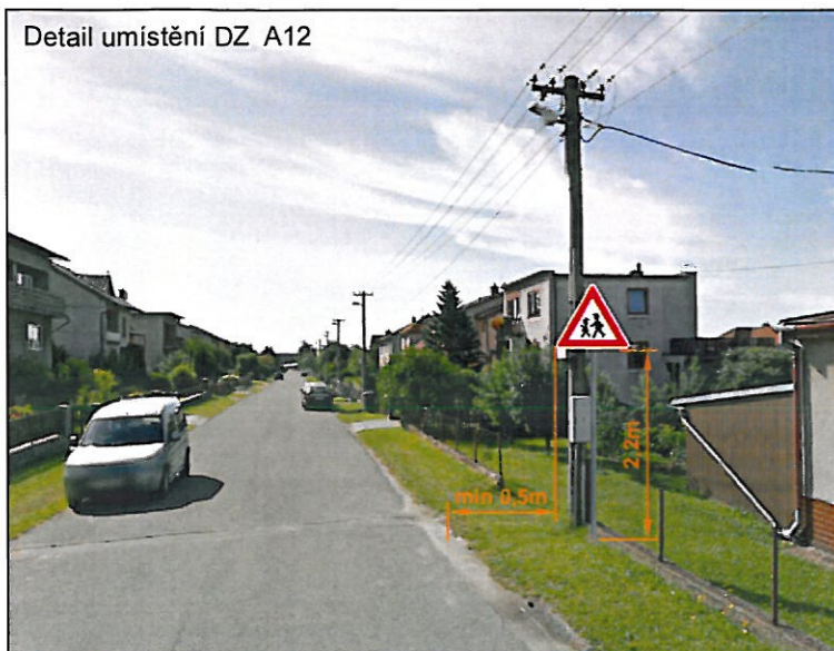
Detail umístění DZ A12