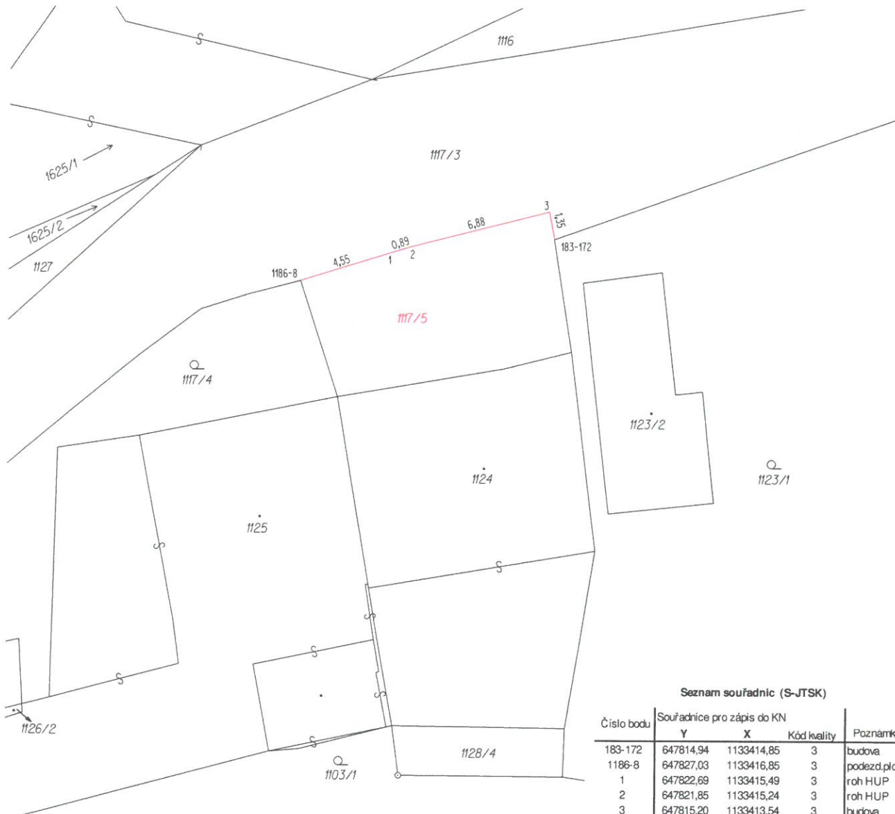
Seznam souřadnic (S-JTSK)